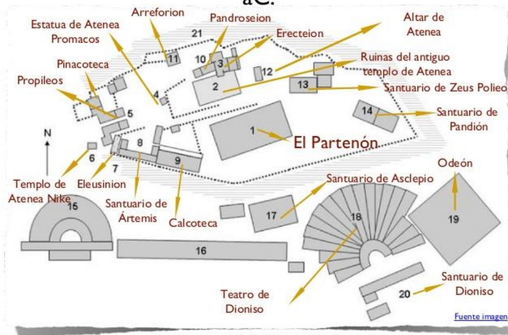
Fig. 2. Mapa de la Acrópolis de Atenas del V. a.C.

https://es.slideshare.net/vplaarmengot/espacios-atenas-clasica-c , fig. nº 15.